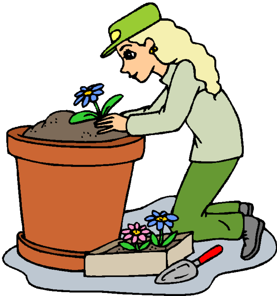
Gardener Người làm vườn