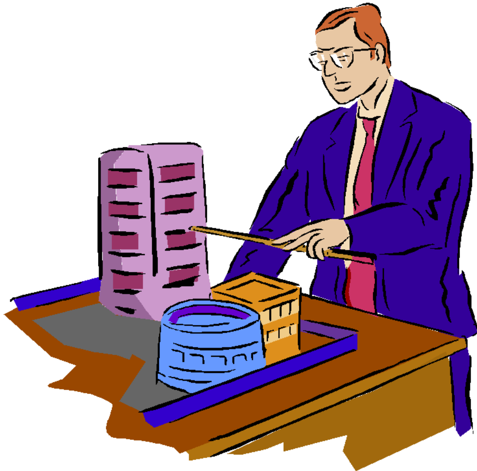
Architect Kiến trúc sư