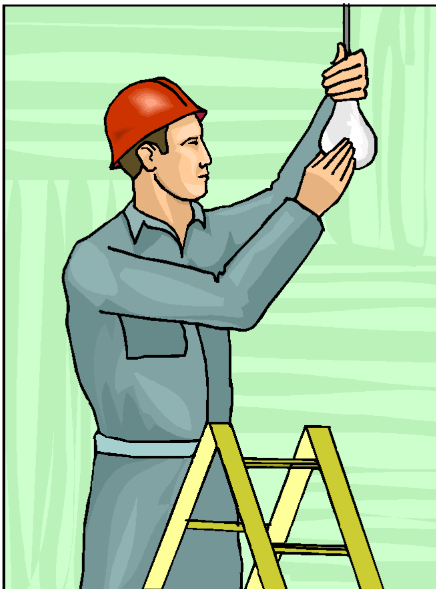
Electrician Thợ điện