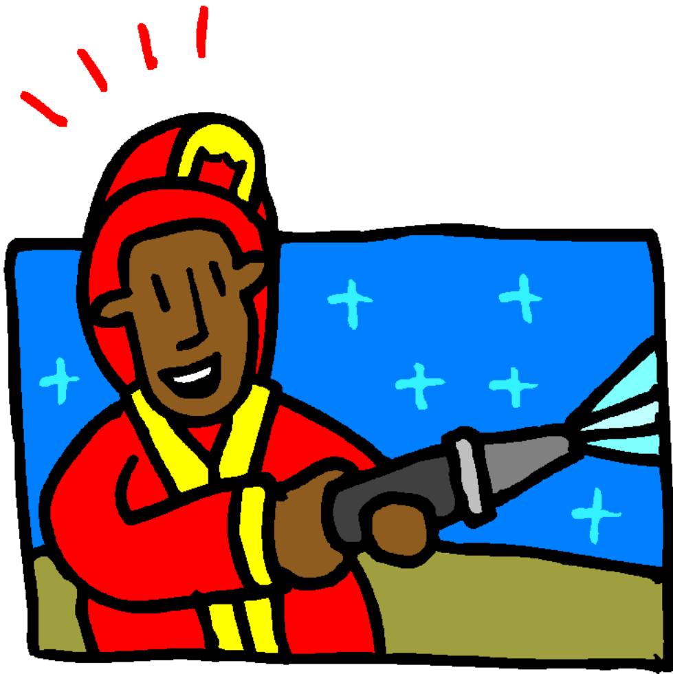
Firefighter Lính cứu hỏa