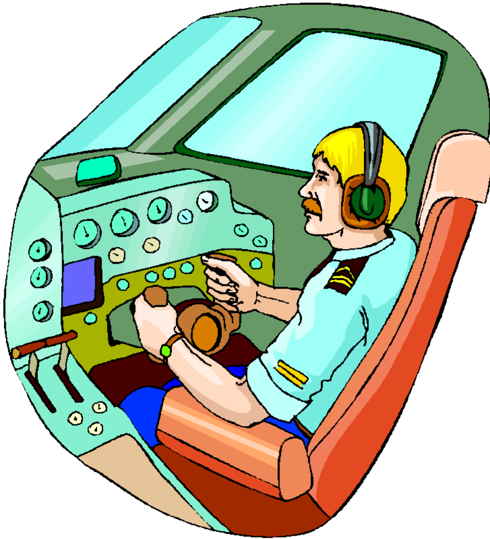
Pilot Phi công