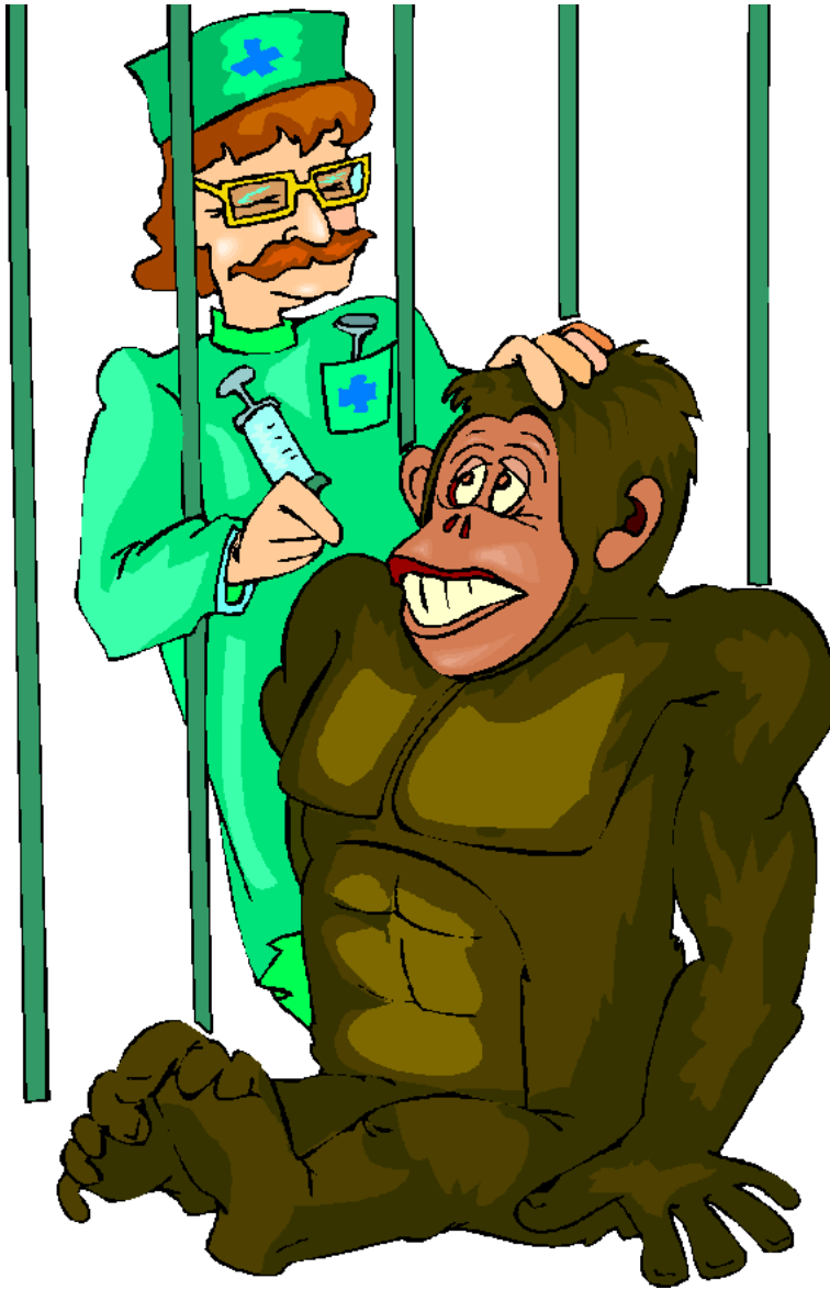
Veterinarian Bác sĩ thú y