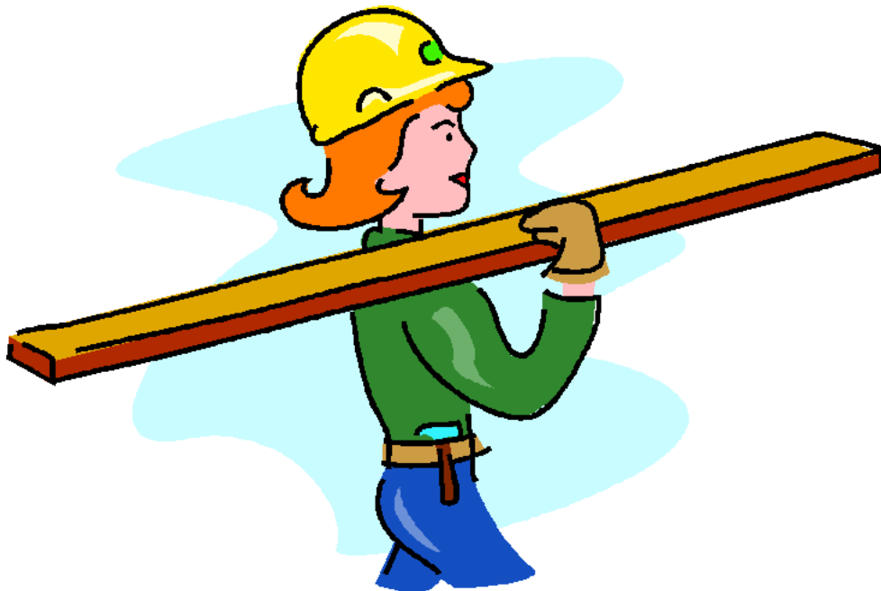
Construction Worker Công nhân xây dựng