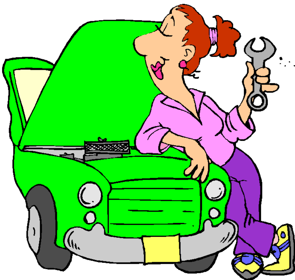
Mechanic Thợ cơ khí