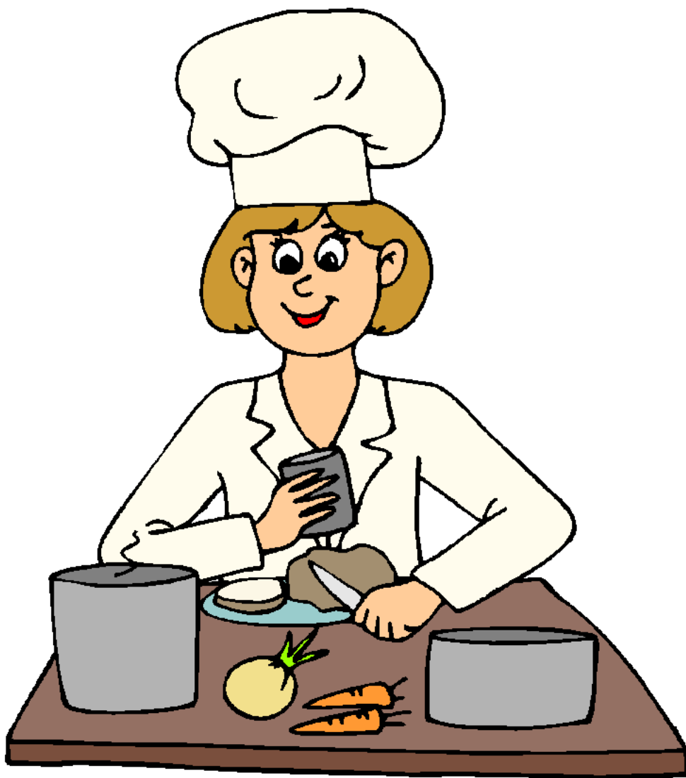
Chef Đầu bếp