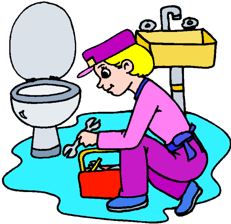
Plumber Thợ sửa ống nước