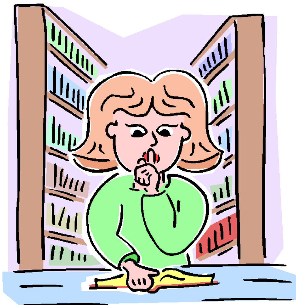
Librarian Thủ thư