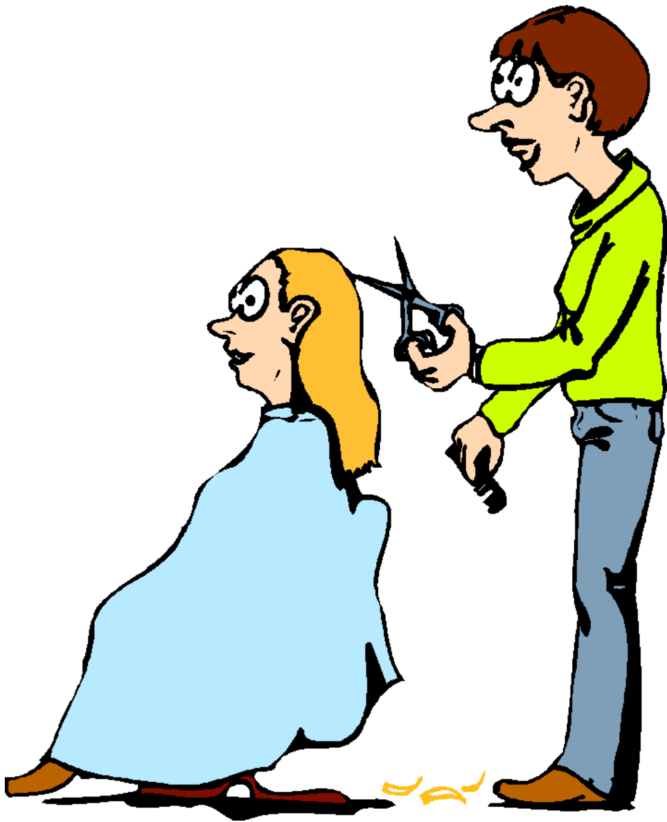
Hairstylist Nhà tạo mẫu tóc