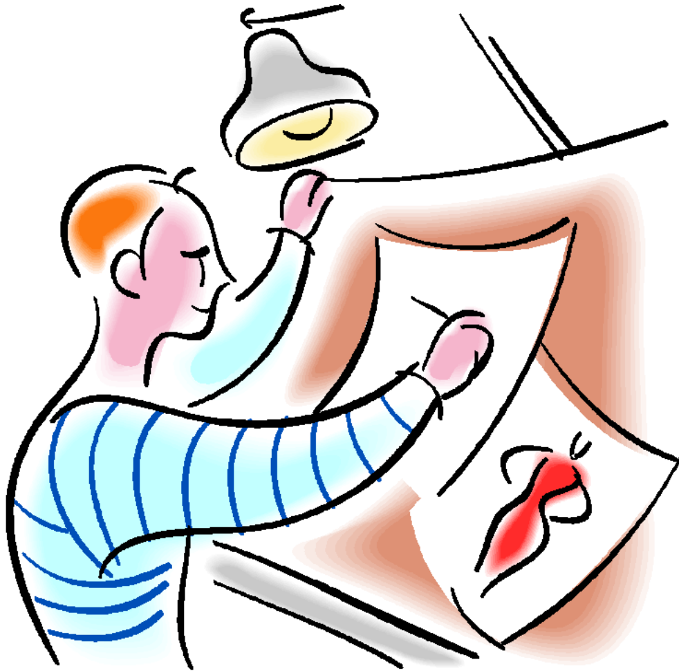
Fashion Designer Nhà thiết kế thời trang