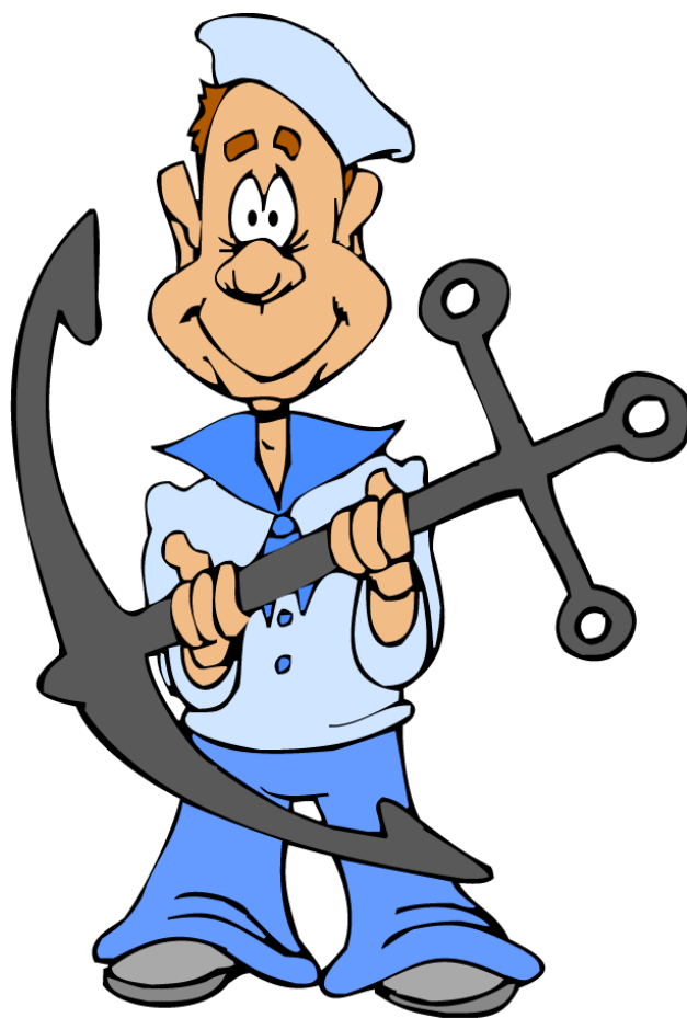
Sailor Thủy thủ