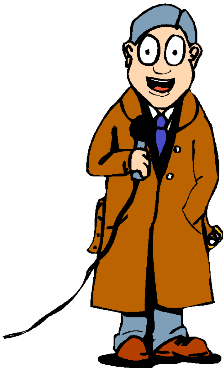
News Reporter Phóng viên thời sự